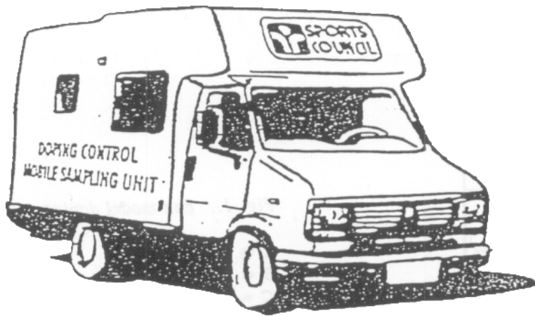
Fig. 3. Een ander alternatief model voor een dopingcontrolestation